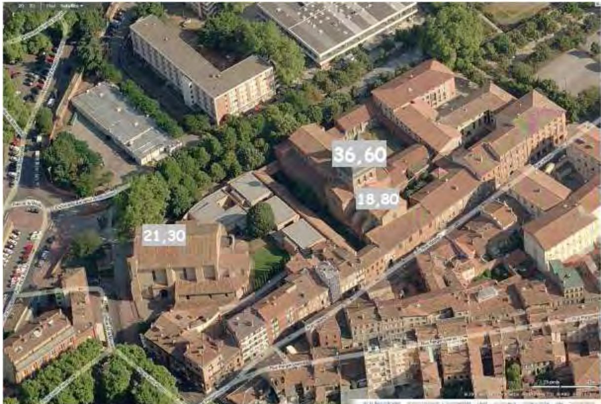
Hauteurs en mètres par rapport au niveau du terrain naturel