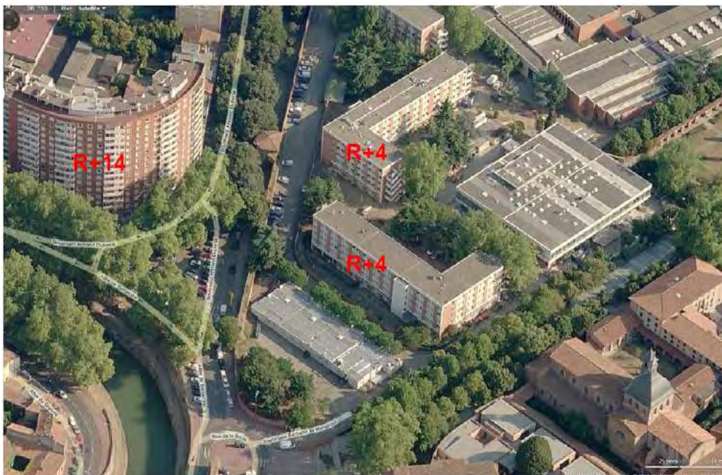
Photo aérienne de la Cité Universitaire de l'Arsenal et de l'immeuble au 16 Allée de Barcelone – Nombre de niveaux des bâtiments