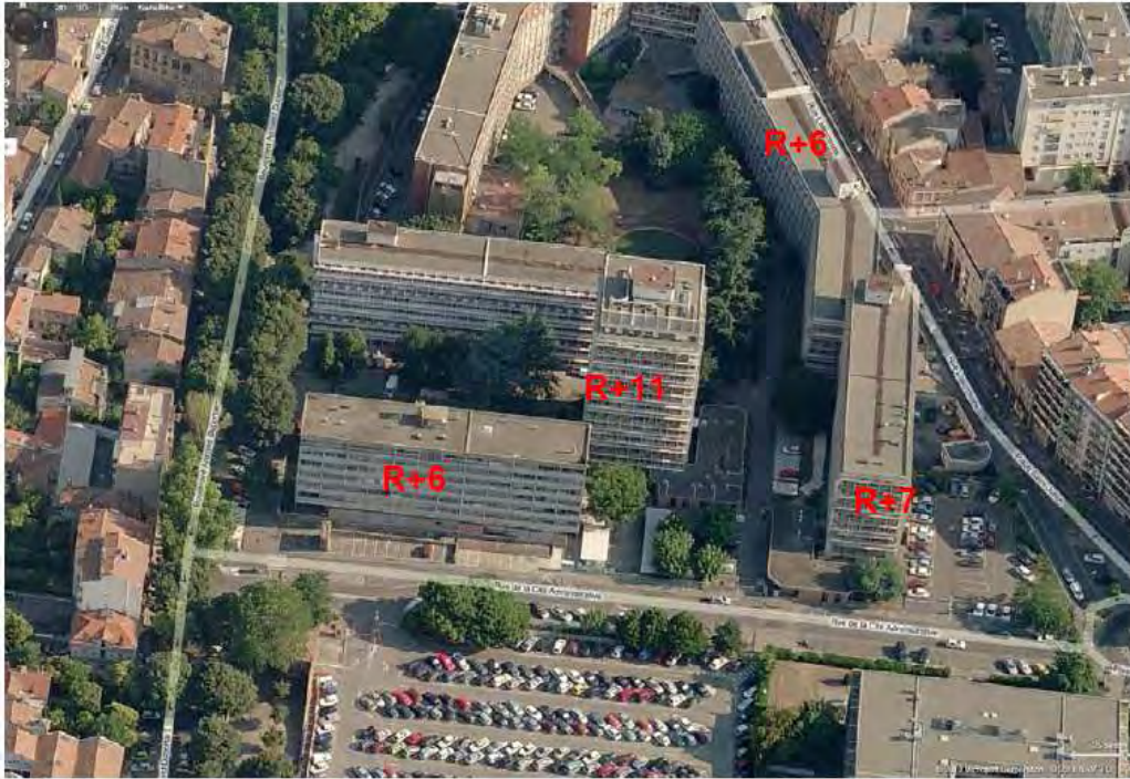
Photo aérienne de la Cité Administrative – Nombre de niveaux des bâtiments

Le site de l'Arsenal est situé à proximité du Canal de Brienne, de la Garonne et de Saint Pierre des Cuisines. Il appartient à un tissu urbain dense et au centre ancien de Toulouse, où les hauteurs des bâtiments s'échelonnent de 15 m à 27 m de hauteur, dont les plus marquants sont : une cour d'immeuble de R+14, les bâtiments de la cité administrative de R+6 à R+11, Saint-Pierre des Chartreux, dont le dôme culmine à 36,60 m de hauteur sans la statue.