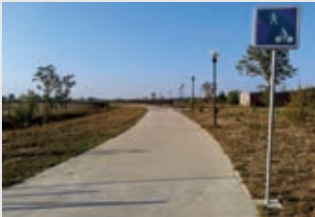
Signalisation des voies vertes